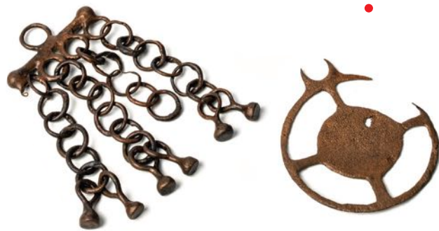
Rochelongue. Pendentifs cliquetants, chaînettes, pendeloques.

Découvert en 1964 au large du Cap-d'Agde (Hérault) par une équipe animée par André Bouscaras, le « dépôt » de Rochelongue constitue la plus importante masse métallique de la Gaule méditerranéenne. Il est composé de 1700 objets de bronze et plusieurs centaines de kilos de lingots de cuivre. Il s'inscrit dans la problématique des dépôts launaciens, cachettes de bronzes enfouies en Languedoc au VII e et début du VI e siècle av. n. è. Il s'en éloigne toutefois car il est le seul « dépôt » (?) maritime de la série, et le plus récent de ces ensembles (vers 575-550 av. n.è.). Son interprétation comme un sanctuaire marin est discutée. De récentes analyses suggèrent que le cuivre des lingots serait majoritairement originaire du sud de la péninsule Ibérique. La thèse d'un récupérateur de métaux cabotant depuis cette aire, dans un contexte de relations avec la sphère ibéro-punique et ayant fait naufrage à Agde, semble confortée par la présence d'objets collectés tout au long des côtes catalanes et languedociennes.