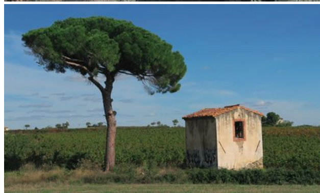
Abbaye Saint-André, Gard. Vignoble du saint-chinianais.

Au fil des siècles, les palettes végétales des parcs et des jardins ont évolué tout comme ont évolué les villes et les paysages ruraux. Notre lien aux arbres, les usages, mais aussi les modes, ont favorisé la présence de certaines essences pour aboutir à une véritable carte d'identité végétale de chaque époque, particulièrement en région méditerranéenne. De par leur longévité, oliviers, cyprès, grenadiers, amandiers, mûriers, lauriers nobles, arbres de Judée, platanes, cèdres, séquoias, ginkgos, arbousiers de Chypre, orangers des Osages, mais aussi bambous, palmiers... se côtoient, et pourtant chacun raconte une histoire singulière. La présentation s'appuiera sur quelques exemples pour mettre en lumière la valeur patrimoniale des paysages méditerranéens à travers les arbres qui les composent.