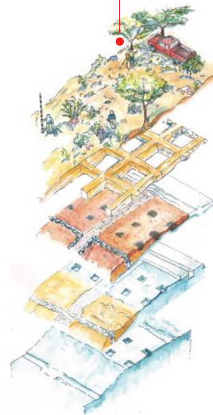
Les strates archéologiques du jardin. © Aquarelle, K. Gleason in Sourcebook for Garden Archaeology, Methods, Techniques, Interpretations and Field examples , éd. A.-A. Malek, Berne, 2013.

Si l'archéologie des jardins se développe graduellement, depuis que les archéologues reconnaissent leur possible existence et réalisent qu'un espace vide ou résiduel est susceptible d'être un jardin, elle fut longtemps reléguée à l'étude des jardins historiques et à leur restitution. Elle a depuis démontré sa capacité à enrichir la connaissance de ces jardins dont on croyait connaître tous les aspects grâce à la documentation textuelle et visuelle. La recherche non seulement de la configuration en surface du jardin (parterres, trous de plantation, allées, etc.), mais aussi de sa mise en œuvre en tant qu'environnement construit, conduit à une nouvelle compréhension des structures profondes du site et de son intégration dans l'environnement. Une telle conception du jardin révèle une maîtrise des contextes qui reste certes encore à développer mais qui d'ores et déjà ouvre sur l'histoire de la technologie, de la botanique, de l'horticulture et des établissements humains et sur leur insertion dans leur environnement.