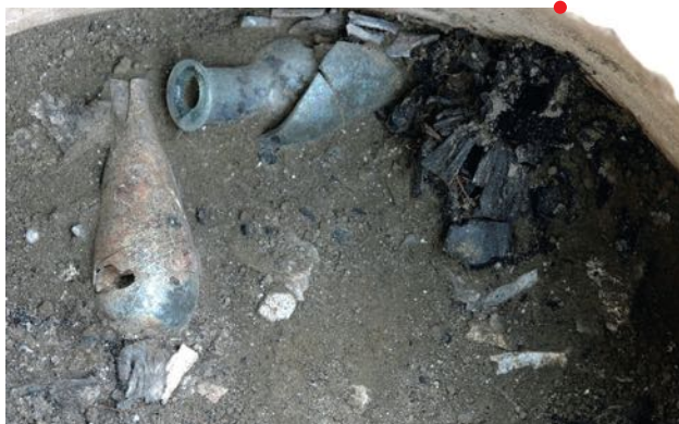
Vue du résidu de crémation déposé à l'intérieur d'une urne funéraire et montrant la présence, au contact des balsamiques, d'un cône de pin pignon carbonisé.

Alain Schnapp , professeur émérite, Université Paris 1 Panthéon-Sorbonne, ancien directeur de l'Institut national d'Histoire de l'Art