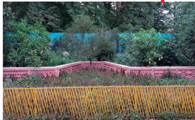
De la nature. © SPIN - Carlotta Montefoschi et Niccolò Cau, architectes, Ricardo Walker Campos et Giulia Tasselli, paysagistes, Festival international des jardins de Chaumont-sur-Loire, 2022.

La découverte de la scène de chasse sur la façade de la Tombe de Philippe II de Macédoine a profondément renouvelé la question de la représentation des espaces naturels dans la peinture grecque et romaine entre le IV e siècle av. n. è. et les premiers siècles av. et apr. n. è., lorsque Vitruve, puis Pliny l'Ancien, décrivent sous le nom de topia et de topiaria opera des thèmes paysagers, qui sont largement documentés par les témoignages archéologiques contemporains de ces auteurs. On reviendra sur la genèse et les enjeux de telles représentations à travers un choix de textes et d'images.