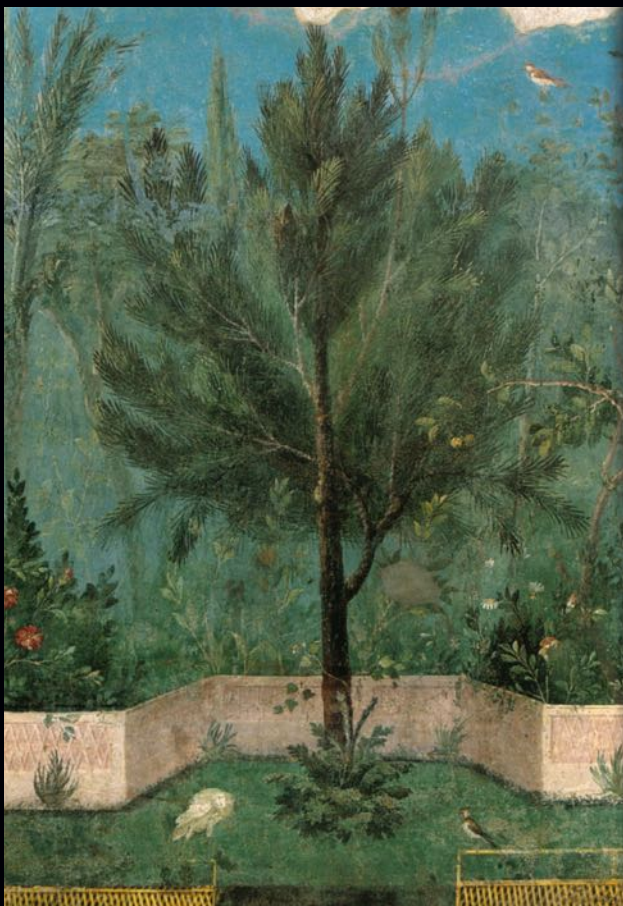
Fresque représentant un jardin verdoyant dans la Villa Livia, Rome (I er siècle. av. J.-C.). Musée national romain, Palazzo Massimo alle Terme.

Cycle de conférences tout public proposé par le Musée des Moulages (Université Paul-Valéry / Montpellier 3) et le site archéologique Lattara – musée Henri-Prades, en partenariat avec le Musée Fabre, le LabEx Archimède et le laboratoire de recherche ASM (UMR-5140, CNRS) de l'Université Paul-Valéry / Montpellier 3