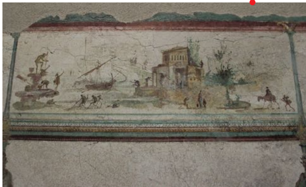
Détail de la frise de la Casa della Farnesina, Palazzo Massimo alle Terme, inv. 1233, Rome.