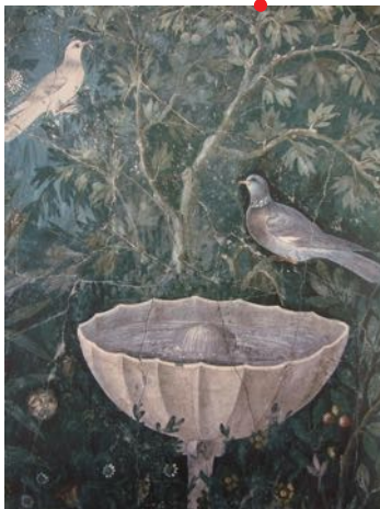
Vasque avec oiseaux. Maison du bracelet d'Or, Pompéi

Murray Schafer, musico- logue et compositeur, publiait son livre The tuning of the world , qui résumait bon nombre de ses travaux sur le sound- scape , autrement dit, le « paysage sonore ». Il était loin de se douter de l'écho que cette notion allait connaître dans les sciences humaines et sociales malgré la défini- tion très vague qu'en pro- posait l'auteur. Traduit en France en 1979 sous le titre Le paysage sonore ,