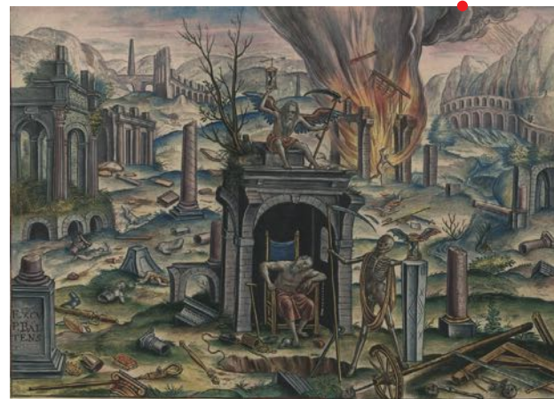
Hans Vredeman de Vries, Theatrum vitae humanae , 1577. Bib. municipale, Lyon.