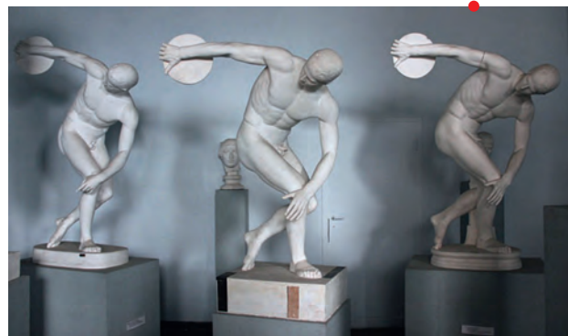
Moulages du Discobole de Myron, Université de la Sapienza, Rome.

Le sport naît en Grèce dans le courant du VI e s. av. J.-C. Apparaissent alors les premiers stades et les premiers gymnases, se constitue le premier calendrier de compétitions sportives, se systématisent la pratique de la nudité athlétique. Mais le VI e s. voit, d'abord et avant tout, surgir une figure nouvelle dans le paysage social des cités grecques : l'athlète, individu qui consacre l'essentiel de son temps à l'entraînement et à la compétition. À travers le portrait du plus célèbre des athlètes de l'Antiquité, le lutteur multiple champion olympique Milon de Croton, on découvrira les conditions de naissance de la première culture sportive de l'histoire, mais aussi le quotidien des anciens sportifs, entre exercice, règles diététiques et voyages vers les sites des grands concours ? Comment se construisent les palmarès ? Quelle valeur accorde-t-on à la victoire sportive ? Comment honore-t-on les athlètes ? Quels exploits prête-t-on aux champions et quelles légendes entourent leur existence ? Dans quelle mesure cette première forme de sport peut-elle être pensée comme un avatar de la guerre ?