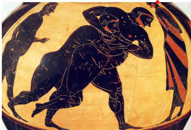
Scène de lutte amphore panathénaïque de la première époque (566-530 av. J.-C.), Badisches Landesmuseum Karlsruhe, 65/45.

Le sport naît en Grèce dans le courant du VI e s. av. J.-C. Apparaissent alors les premiers stades et les premiers gymnases, se constitue le premier calendrier de compétitions sportives, se systématisent la pratique de la nudité athlétique. Mais le VI e s. voit, d'abord et avant tout, surgir une figure nouvelle dans le paysage social des cités grecques : l'athlète, individu qui consacre l'essentiel de son temps à l'entraînement et à la compétition. À travers le portrait du plus célèbre des athlètes de l'Antiquité, le lutteur multiple champion olympique Milon de Croton, on découvrira les conditions de naissance de la première culture sportive de l'histoire, mais aussi le quotidien des anciens sportifs, entre exercice, règles diététiques et voyages vers les sites des grands concours ? Comment se construisent les palmarès ? Quelle valeur accorde-t-on à la victoire sportive ? Comment honore-t-on les athlètes ? Quels exploits prête-t-on aux champions et quelles légendes entourent leur existence ? Dans quelle mesure cette première forme de sport peut-elle être pensée comme un avatar de la guerre ?