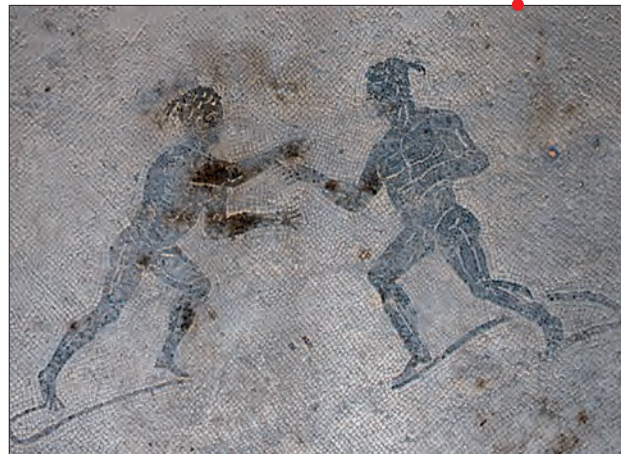
Mosaïque du I er s. apr. J.-C. représentant des athlètes aux prises, Pompéi (VIII, 2, 3).

Les thermes, au-delà d'une installation consacrée au nettoyage des corps, sont une institution essentielle à la vie quotidienne et civique des communautés du monde romain. Leur caractère public suppose qu'on y suit un certain nombre de comportements que nous aurions tendance à restreindre à la sphère privée. De plus, les soins du corps doivent y être pris dans un sens plus large et nombre d'auteurs insistent sur leur encadrement au sein d'une réflexion globale. Les activités sportives sont incluses dans ces raisonnements, à la fois moraux, médicaux et civiques. Nous allons donc les examiner, autant dans leurs modalités que dans les attentes auxquelles elles sont censées répondre.