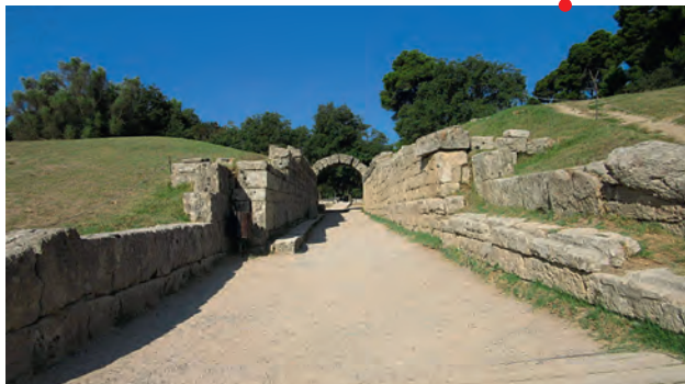
Olympie (Grèce), l'entrée du stade antique.

Conférence en partenariat avec l'association Guillaume-Budé