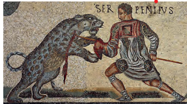
Mosaïque des Gladiateurs, villa Borghèse, Rome. Détail.

À partir du II e siècle av. J.-C., l'activité ludique de la chasse se développe à Rome. La passion pour cette activité culmine aux trois premiers siècles de l'Empire et sa transposition dans les spectacles de l'amphithéâtre en sont l'expression la plus aboutie. Les chasses amphithéâtrales ( venationes ) sont ainsi parfois plus populaires que les combats de gladiateurs, comme en Afrique.