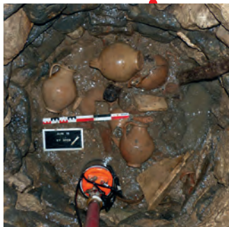
Le puits de l'Auribelle en cours de fouille.

La conférence présentera cette documentation totalement inédite et lèvera (un peu) le voile sur ce mystérieux dépôt.